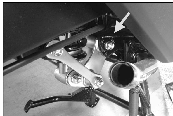
車体右後方から見た図